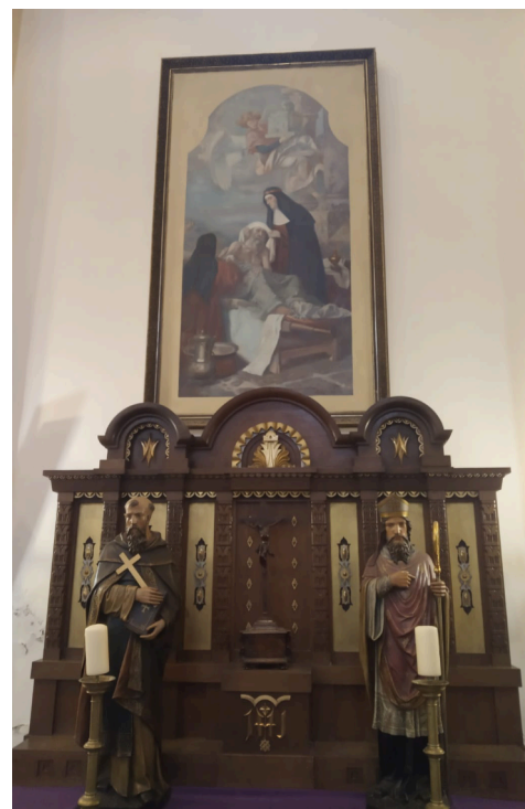
Obraz "Svatá Anežka ošetřuje nemocného" v říčanském kostele