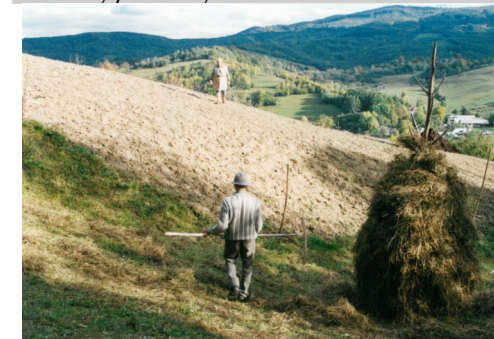
Nová Sedlica, než nastanou plískanice a napadne sníh (rok 2000)

Další čtení: Skaloš, J. 1999. Bukovské vrchy – slovenská Ukrajina? NIKA, Hory si pamatují všechno, Idnes.cz, magazíny-cestování, Ve stopách zbojníků, Idnes.cz, magazíny-cestování (2001), Nová Sedlica – Pravoslavné Vánoce, youtube, Jan Skalos